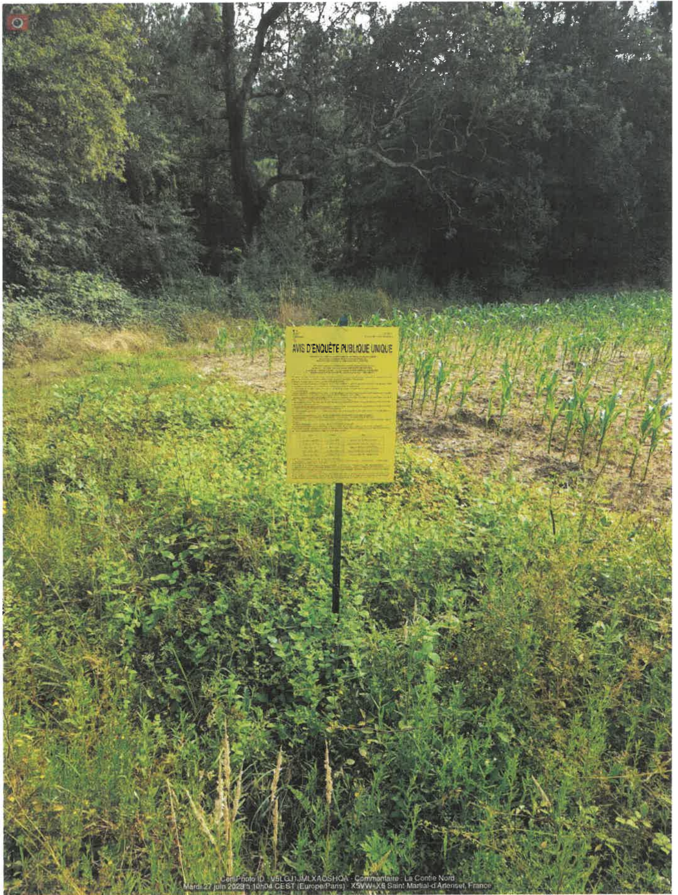
Cerif Photo ID - v8LQJ1J4L XA0SHCA - Caméra: La Cente Nord Mardi, 27 juin 2023 à 10h04 CEST (Europe/Paris) - X5W X6 Saint-Marthal-d'Artenet, France