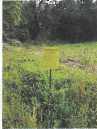
La Contie Nord

V5LGJ1JMLXAOSHQA Signé par CertiPhoto Horodaté par EnTrust Le 27/06/2023 à 10h09 CEST Amazon EC2 Paris Zone A