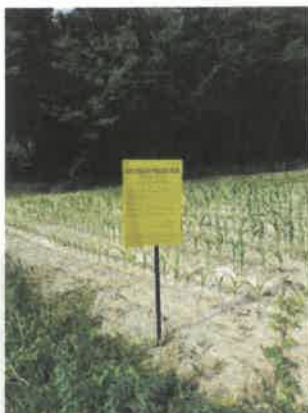
La Contie Sud

5IJ4VJQMEBH3XU2S Signé par CertiPhoto Horodaté par DigiCert Le 27/06/2023 à 10h14 CEST Amazon EC2 Paris Zone A