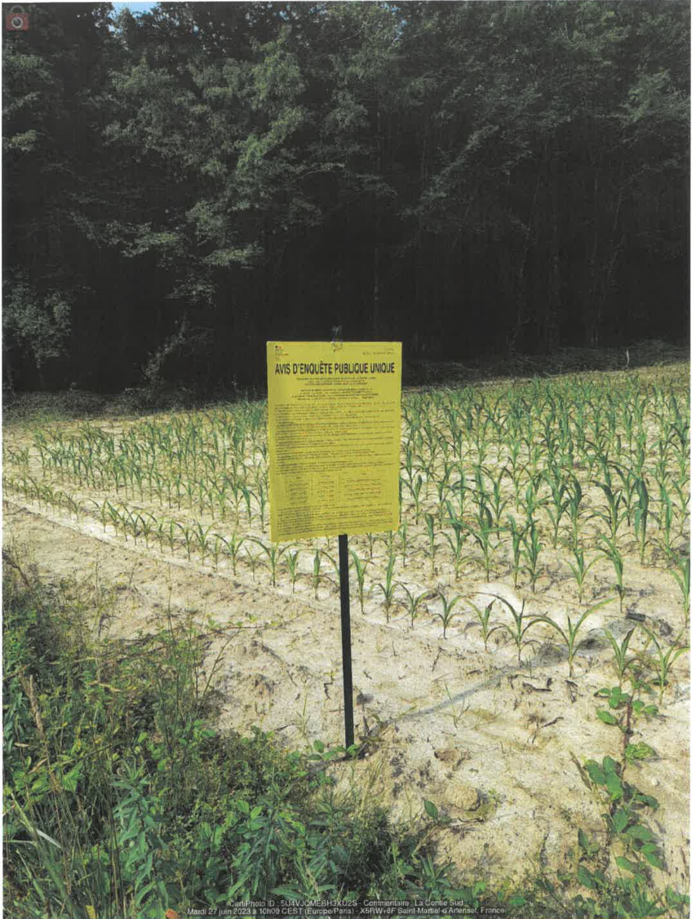
CartiPhoto ID : 5JHVJOMEBH3XU25 - Commentaire - La Conlie Sud Mardi 27 juin 2023 à 10h09 CEST (Europe/Paris) - X5RW+8F Saint-Martial-d'Artenet, France