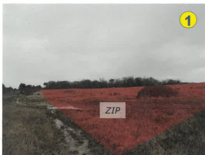
Vue vers l'est depuis la bordure nord-ouest des terrains