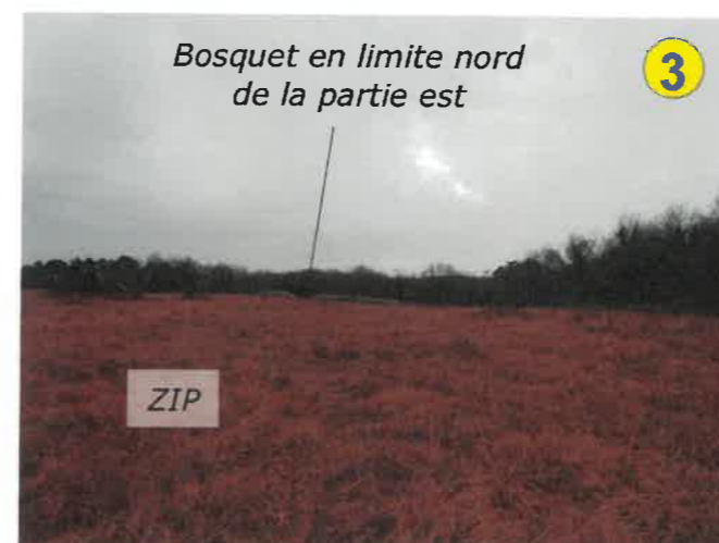
Vue vers le sud depuis la bordure centrale ouest des terrains