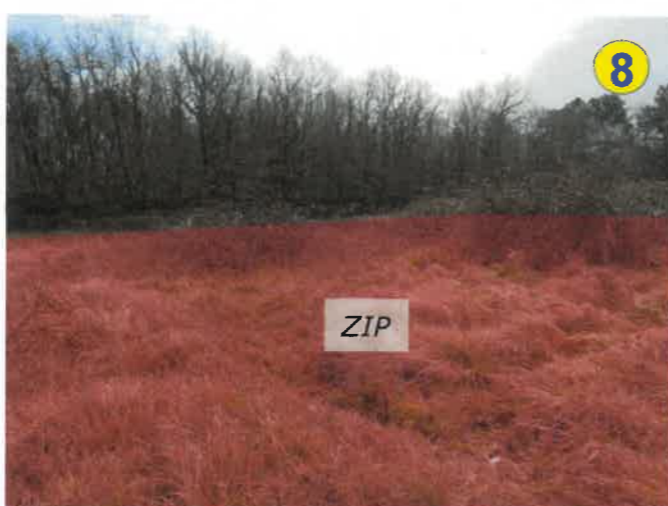
Vue vers le sud sur la partie sud-est des terrains