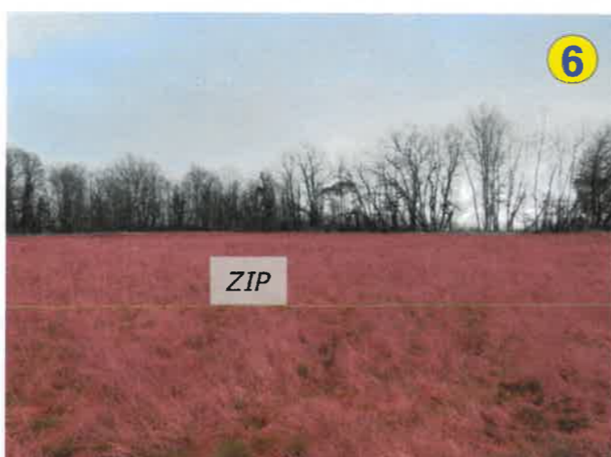
Vue vers l'est depuis la partie nord-est des terrains