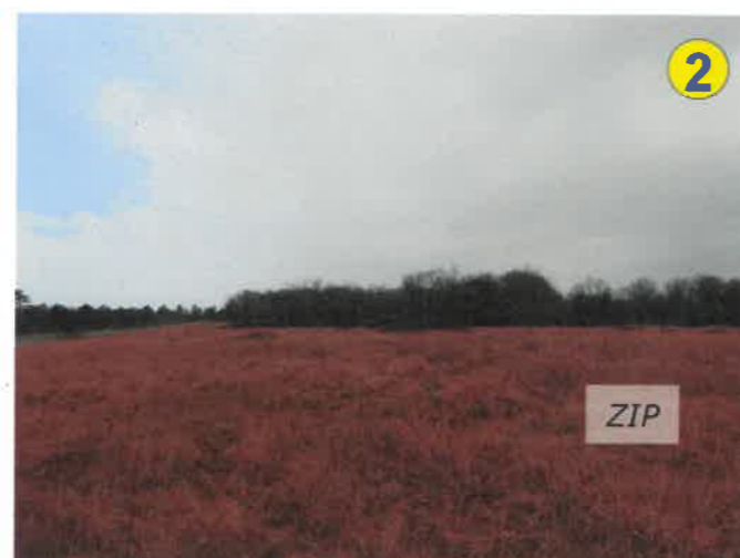
Vue vers l'est depuis l'ouest des terrains