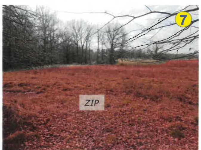
Vue sur la partie est des terrains depuis le chemin en bordure est de la ZIP