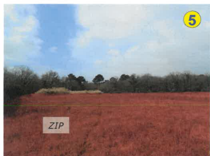
Vue vers l'ouest depuis la partie sud-est des terrains