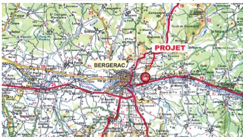
Plan de situation (extrait de l'étude d'impact)

Suite à une visite de terrain réalisée le 20 mai 2015, l'impact du projet sur le milieu naturel a été jugé limité. Aucune zone humide n'a été répertoriée sur le site et le dossier indique que la faune observée dans les lisières et les haies est habituelle du secteur. Les principaux enjeux environnementaux de ce projet concernent la gestion et la protection de l'eau, en lien avec une problématique de santé humaine en raison de la présence d'une source et de deux puits sur le site, ainsi que les nuisances potentielles du chenil en termes de bruit.