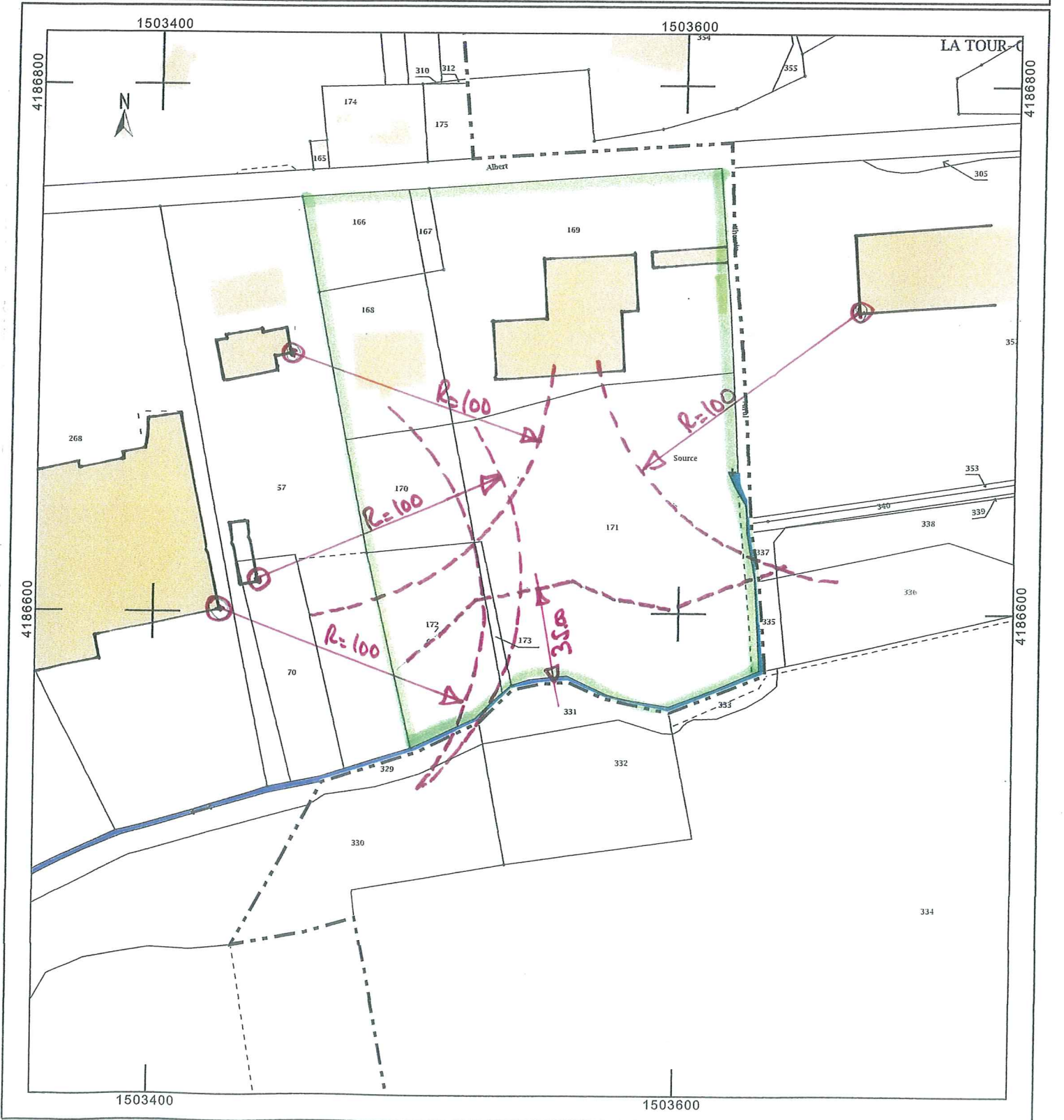
PLAN CADASTRAL (Limites constructives CHENIL)

Cet extrait de plan vous est délivré par : cadastre.gouv.fr